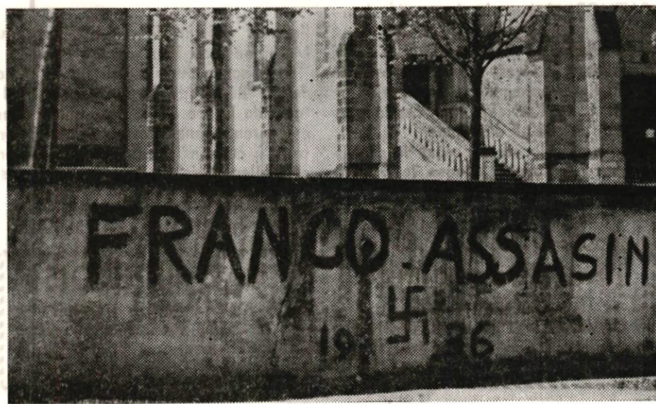
INSCRIPTION EN PAYS BASQUE

Nos lecteurs sont invités à prolonger cette action.