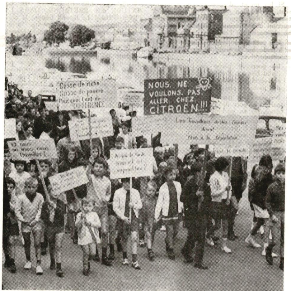
Les ouvriers de l'usine J. Garnier et leurs familles ont défilé silencieusement dans les rues de Redon le samedi 4 juillet. Les enfants, en tête du cortège, portaient des pancartes avec des slogans tels que « gosses de riches, gosses de pauvres, pourquoi tant de différences ? » et « les travailleurs de chez Garnier disent non à la déportation ». Une solution serait en vue ; des négociations en cours avec les Fonderies de Choisy sur le point d'aboutir. Souhaitons que cette solution ne soit pas un leurre, pour gagner du temps (cf. Hennebont).