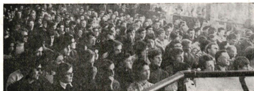
VUE PARTIELLE DE L'ASSISTANCE DANS LA SALLE

trempe... » bien différent de l'autoroute que suivent ceux « ...qui trouvent plus confortable d'être avec le plus fort : ceux-là vous diront qu'ils aiment la Bretagne, mais c'est leur Bretagne à eux, celle qu'ils dominent. Ils rêvent de devenir calife breton à la place du calife français ».