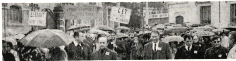
(Cliché « Le Peuple Breton »)

Ils ne regrettèrent sans doute qu'une chose, c'est d'avoir été les seuls : Où étaient les militants laïques d'Ar Falz, voire de Galv ? Les Bretons ne se déferont-ils donc jamais de ce complexe d'infériorité qui veut qu'un professeur de breton soit par définition bien moins important qu'un maître d'éducation physique ou de philosophie ?