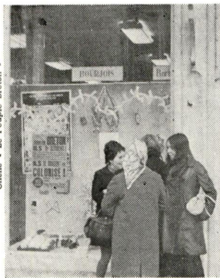
PRESENCE DE L'U.D.B. AUX « NOUVELLES GALERIES » DE QUIMPER

— A Quimper, le combat du personnel des « Nouvelles Galeries » se poursuit (voir