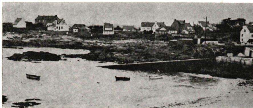
KERROCH, A PROXIMITÉ DE LORIENT

pas. « Quand on se réunit, tout le monde parle en même temps, on n'arrive pas à se mettre d'accord. » Un certain manque d'habitude de la discussion collective, donc. Et puis, pour une coopérative de vente, il y aurait des concurrents — pas des rigolos —. Les problèmes des coopé-