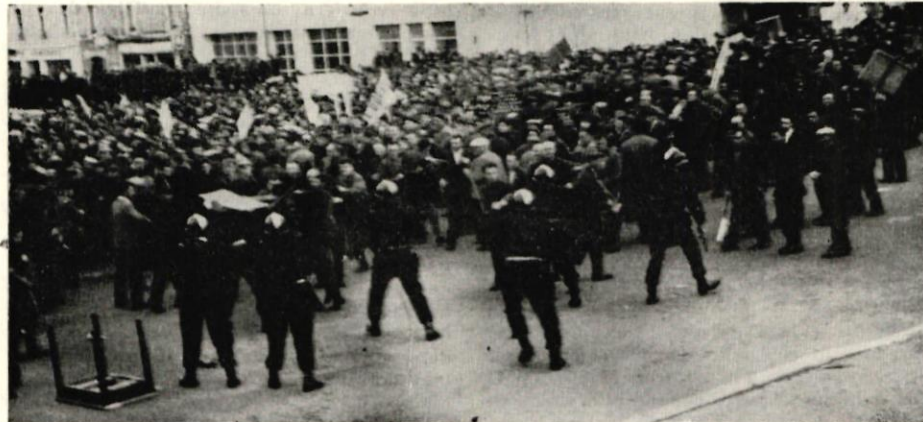
« ALLEZ-Y ! SONNEZ-LES... »

Par contre, les productions animales (viande porcine et aviculture en particulier) ne bénéficient d'aucun soutien réel. Or, les produits d'élevage représentent plus de 75 % de la production agricole finale de la Bretagne qui produit en outre environ 35 % des poulets en France, 20 % des œufs ; 80 % des agriculteurs bretons sont concernés par la production porcine (moyenne française : 57 %).