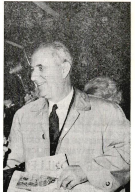
M. GASTON DEFFERRE, lors du retour du voyage qu'il fit en mars dernier aux U.S.A. et au cours duquel il rencontra notamment le président Lyndon Johnson.