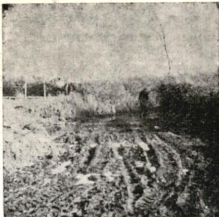
La route desservant la ferme...

Cette ferme est à près de 2 km du bourg ! il n'y a pas l'eau de la ville. L'eau sous pression n'est installée qu'aux frais du cultivateur (sans subvention). Dans l'exemple choisi, la demande a été faite il y a cinq ans... Depuis 1952 il y a l'électricité (au bourg, depuis 1920). La route desservant la ferme n'a pas changé depuis cinquante ans !